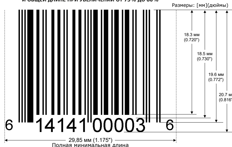
СИМВОЛ EAN С МИНИМАЛЬНЫМИ РАЗМЕРАМИ ПО ВЫСОТЕ И ОБЩЕЙ ДЛИНЕ ПРИ УВЕЛИЧЕНИИ ОТ 75% ДО 80%

При печати на печатающих устройствах для печати по требованию (термопринтерах или лазерных принтерах) окончательная ширина элементов символов EAN ДОЛЖНА быть не менее значений, предусмотренных для увеличения 75%. Если ширина элементов напечатанного символа менее значений, предусмотренных для символа при увеличении 80%, то полный символ должен иметь увеличенные свободные зоны и высоту штрихов, чтобы окончательная область была не менее предусмотренной для символов с увеличением 80%. Качество печати символа также должно соответствовать требованиям EAN и составлять 1,5/06/660.